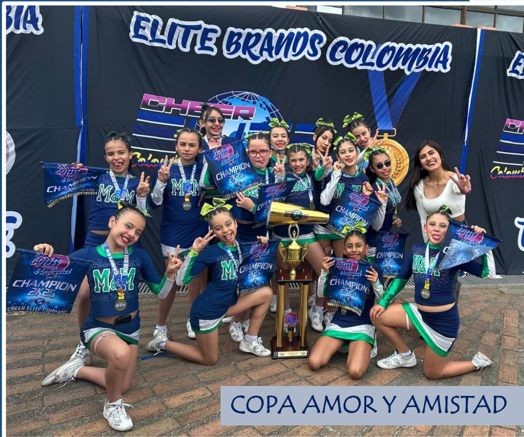
COPA AMOR Y AMISTAD